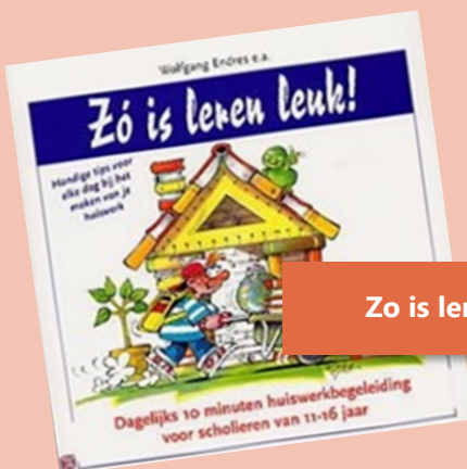
Zo is leren leuk

Help je kind beter te plannen, belangrijke dingen niet te vergeten, omgaan te gaan met frustratie, impulsen onder controle te houden en veranderingen beter te accepteren. Daarnaast helpt 'Vergeeten, kwijt en afgeleid' ook bij heel praktische zaken als zelfstandig huiswerk maken of de eigen kamer opruimen.