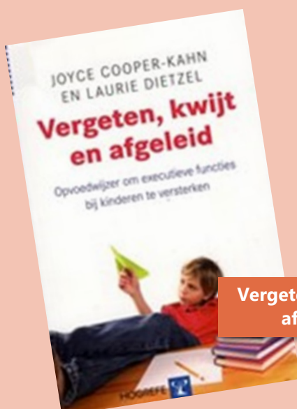
Vergeeten, kwijt en afgeleid