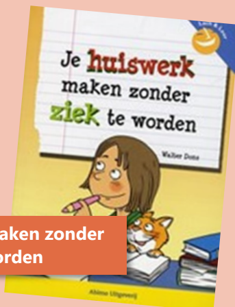
Je huiswerk maken zonder ziek te worden