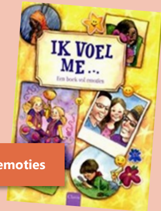
Een boek vol emoties