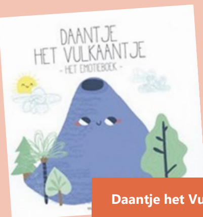
Daantje het Vulkaantje

Daantje het Vulkaantje vertelt over de vier emoties: verdriet, blijdschap, angst en boosheid. Als er iets spannends gebeurt, gaat zijn lava in stapjes omhoog en ontploft hij. Met interactieve vragen en kleurenillustraties. Bevat handvatten om te praten over emoties met kinderen van ca. 5 t/m 8 jaar.