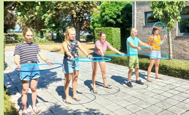
De begeleiders en animatoren zorgden voor de leukste activiteiten!